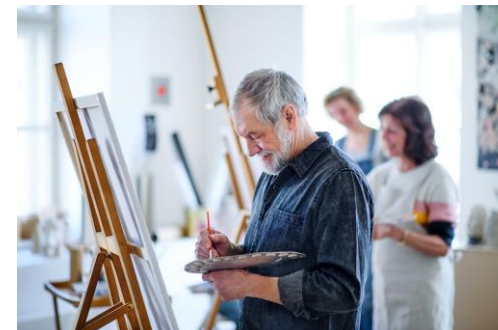
Pieaugušo izglītības sektors KA210-ADU

Maza mēroga partnerību ( Small-scale partnerships ) Erasmus+ darba programmā 2024.gadam Latvijai plānotais EK kopējais finansējums ir 745 116.00 EUR: