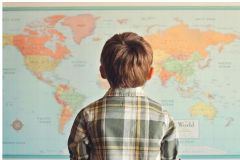
Skolu izglītības sektors KA210-SCH