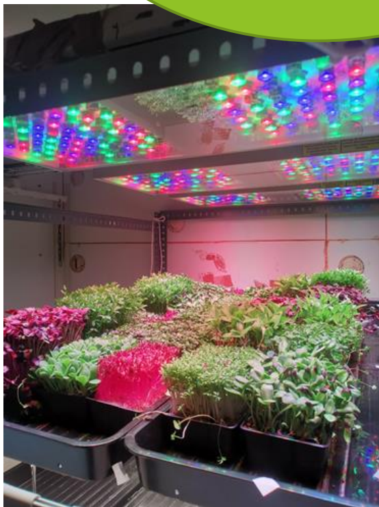
Bulduru Tehnikums / EGS 2

“Eiropas garša un smarža 2”/ “EGS 2” 2020-1-LV01- KA102-077203