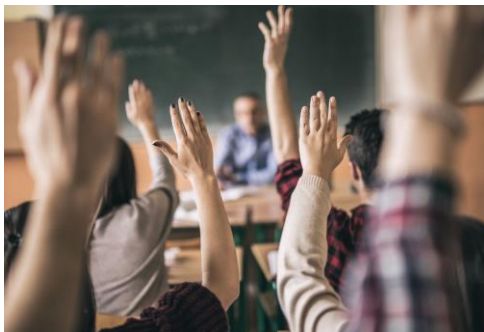
Skolu izglītības sektors KA220-SCH