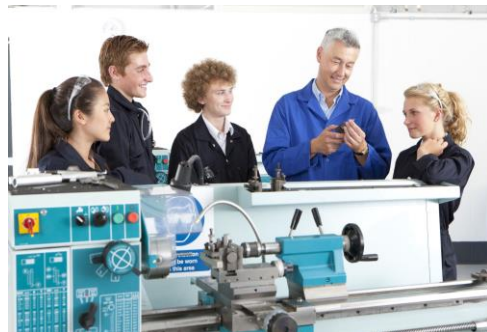
Profesionālās izglītības sektors KA220-VET