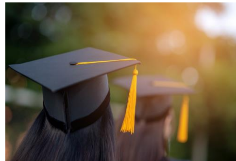
Augstākās izglītības sektors KA220-HED