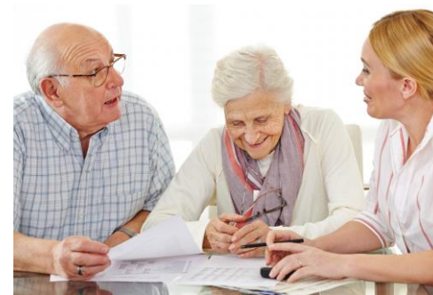
Pieaugušo izglītības sektors KA220-ADU

Sadarbības partnerību ( Cooperation partnerships ) Erasmus+ darba programmā 2023.gadam Latvijai plānotais EK kopējais finansējums ir 3 619 862.00 EUR: