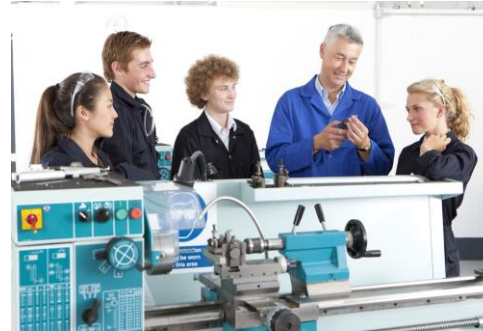
Profesionālās izglītības sektors KA210-VET